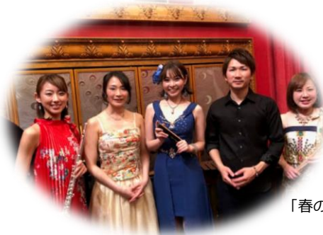
「春の饗宴」終演後の一枚

〒150-0001 東京都渋谷区神宮前 5-37-13 TEL 03-6712-5873